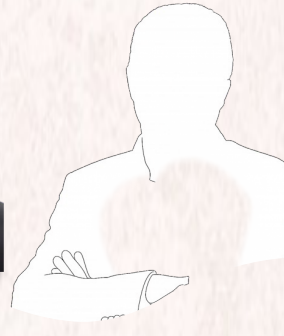
-- Le Président du SYNASAV (élection le 03/03/2026)