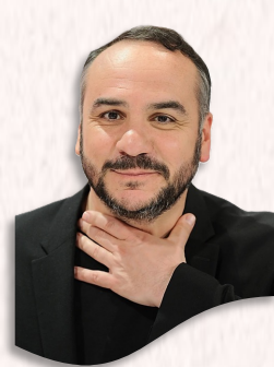
François-Xavier Demaison Acteur, producteur, réalisateur et humoriste